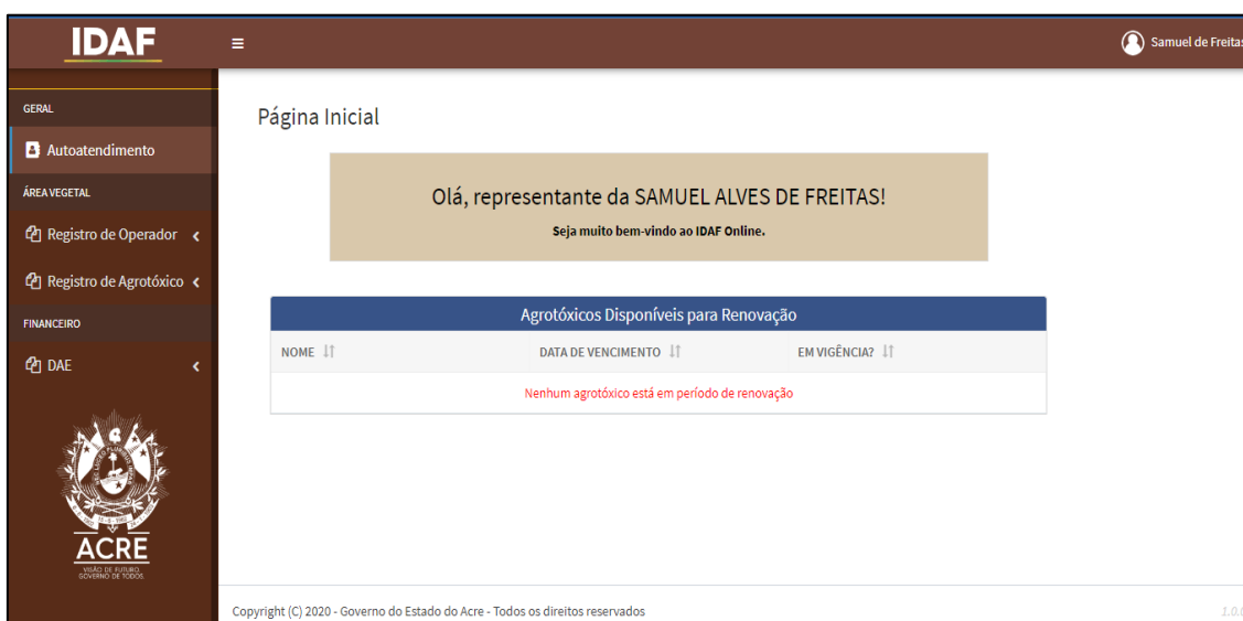
Figura 2: Tela Inicial de Operador de Agrotóxico.

Após realizar o login, a empresa terá acesso à esta tela. Aqui é possível realizar operações com o registro do Operador (Cadastro de Operador de Agrotóxicos – COA) e com registro de produtos (Cadastro de Produtos Agrotóxicos – CPA), caso a empresa seja Titular de Registro de Produtos Agrotóxicos.